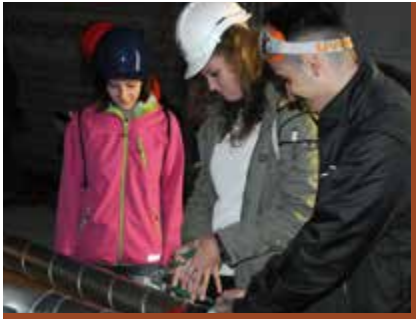
Instruktionen auf der Baustelle: Die Schülerinnen und Schüler lernen das Umfeld hautnah kennen.

Der Rohbau des Gewerbehouses Calandapark ist weit fortgeschritten. Die Bauherrschaft öffnete an vier Tagen die Baustelle für Oberstufenklassen von Fläsch bis Chur und betrieb damit eine Nachwuchswerbung der anderen Art. 18 verschiedene Berufe konnten so direkt auf der Baustelle kennengelernt werden.