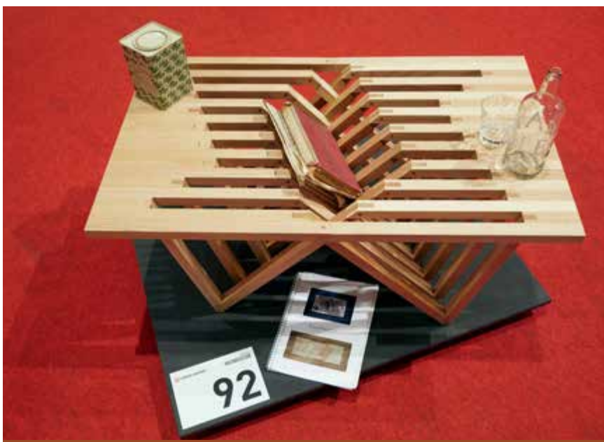
Der Bündner Schreiner Nachwuchswettbewerb (im Bild das Möbel von Jann Jon Fadri) zeigte sich an der Holz 2016 von seiner besten Seite.

Die Messeplattform «Fokus Bildung» hat neben verschiedenen anderen Bildungsanbietern auch die ibW Höhere Fachschule Südostschweiz für einen Messeauftritt genutzt. Das Team präsentierte das umfangreiche ibW-Weiterbildungsangebot und zeigte ein weiteres Mal, wie mit Holz auf einfache Bearbeitungsweise grosse Wirkung erzielt werden kann.