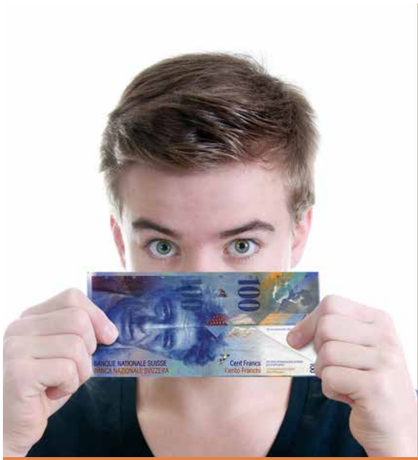
Die Lohnempfehlung des VSSM für die Lehrverträge ab 2017 fällt pro Lehrjahr 100 Franken höher aus wie bisher.

Die laufenden Lehrverhältnisse können selbstverständlich ebenfalls angepasst werden. Für die Schreinerpraktiker EBA sollen die Löhne vorläufig auf dem bisherigen Stand belassen werden. Der VSSM weist darauf hin, dass Löhne für Lernende normalerweise monatlich (12-mal pro Jahr, kein 13. Monatslohn) ausbezahlt werden. Diese nun angepassten Löhne sind Empfehlungswerte. Sie dürfen von Arbeitgebern über- bzw. unterschritten werden.