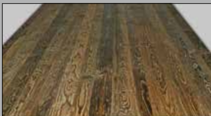
Oberfläche original gehackt

Altholz ist ein vielseitig einsetzbares, ursprüngliches Produkt. Zusätzlich zu unserem breiten Sortiment bieten wir auch 3-Schicht-Platten in Fichte aus original Altholz an: