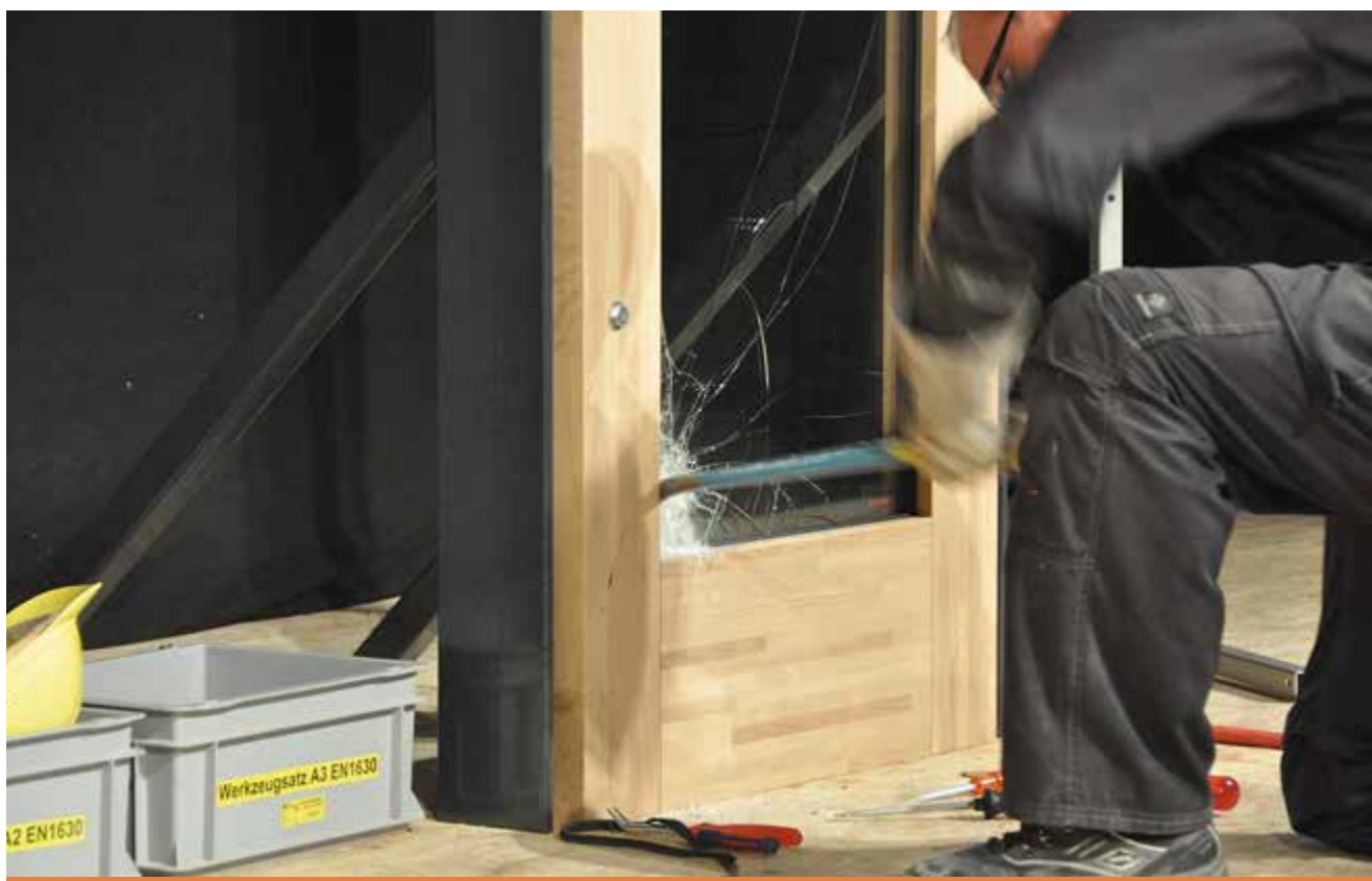
Einbruchversuch: Es ist für den Schreiner entscheidend, dass er die Schwachstellen der Bauteile und die Verbesserungsmöglichkeiten kennt.

Nehmen Sie an einem Fachanlass teil und gewinnen Sie als Hersteller von Bauteilen mehr Sicherheit in Planung und Ausführung. Verbessern Sie durch gesteigertes Fachwissen gleichzeitig Ihre Akzeptanz bei den Baupartnern. Weitere Informationen zu den Fachanlässen und zur Anmeldung folgen rechtzeitig.