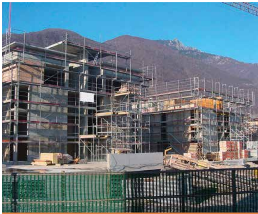
Mit dem LIA will das Tessin sein Gewerbe gegenüber der Konkurrenz insbesondere aus Italien besser positionieren.