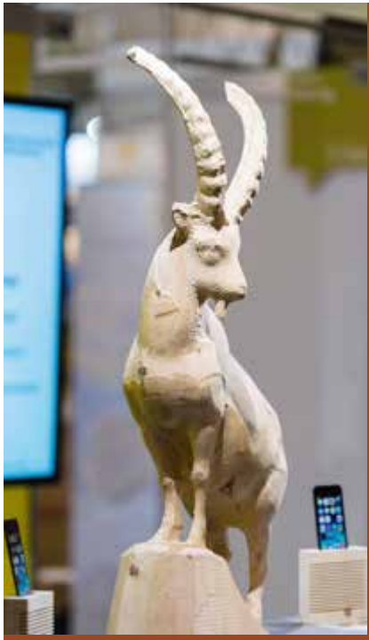
Überzeugte an der Holz in Basel mit hölzernem Steinbock und starkem Weiterbildungsangebot: die ibW Höhere Fachschule Südostschweiz.

Die Holz 2016 in Basel ist Geschichte. Vom 11. bis 15. Oktober besuchten über 33 000 Besucher den wichtigsten Treffpunkt der Holzbearbeitungsbranche, um sich über Trends und Innovationen zu informieren. Auch der Kanton Graubünden setzte ein starkes Zeichen.